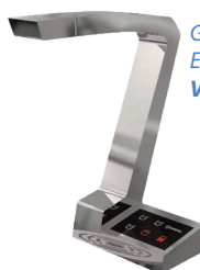
G7 EC - 3 veis. Elektronisk kran. Varenummer: 9910932