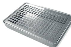
VR-IR bordmodell i rustfritt stål. 220x150x30 med avløp. Varenummer: 9911581