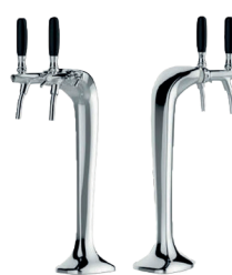
Cobra 2- 2-veis. Forkrommet messing. Leveres med 6m slange og nødvendige overganger til både Jclass og Niagara Varenummer: 9910481