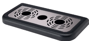
VR-P bordmodell. Panne i plast. Rist i rustfritt stål. 338x160x25 Varenummer: 9910988