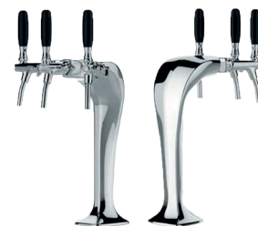
Cobra Light - 3-veis. Forkrommet messing. Leveres med 6m slange og nødvendige overganger til både Jclass og Niagara Varenummer: 9911504