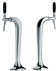
Cobra Plus Large-1-veis. Forkrommet messing. Leveres med 6m slange og nødvendige overganger til både Jclass og Niagara Varenummer: 9910473